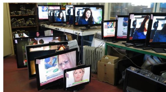
Grâce à un gros travail de recherche et développement, une nouvelle machine va permettre, d'ici quelques mois, de démonter et recycler les écrans plasma et LED.

Envie 2E, au bout du boulevard Thomson à Lesquin. Tél : 03 20 30 76 16.